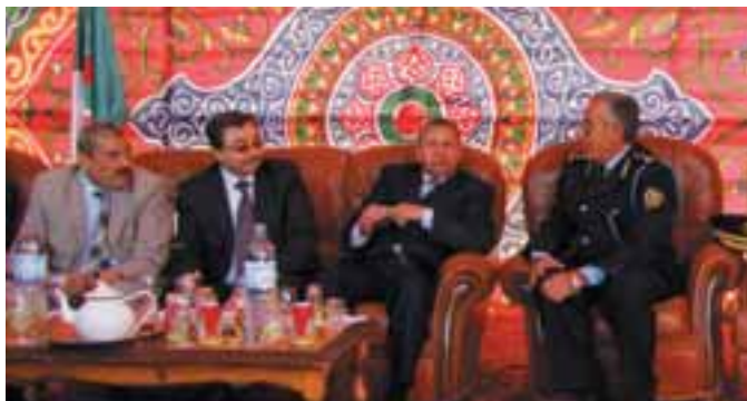
Rencontre des DG des Douanes Algériennes et Libyennes

Ces visites ont permis de faire le bilan des activités de la région, des difficultés rencontrées et d'en établir un canevas des besoins en moyens humains et matériels de ces services, confrontés à la pénibilité du climat et de l'éloignement, pour leur permettre d'accomplir les missions qui leur sont dévolues dans les meilleures conditions possibles. "Si nous voulons exiger d'un agent de douane un effort et un travail sérieux, il faut aussi