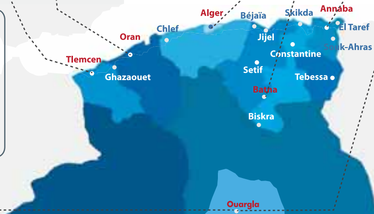
Les nouvelles disp

La Direction Générale des Douanes, à travers son Centre National de la Formation Douanière, dispose de sept (07) écoles de formation initiale, de recyclage et de perfectionnement réparties sur l'ensemble du territoire national. Deux autres écoles sont en cours de réalisation à El Affroun (Blida) et Batna. (Infos Douane n°05 /2010)