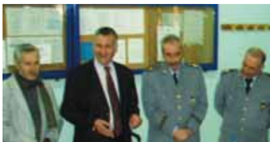
A l'Université de Ferhat Abbas -Sétif